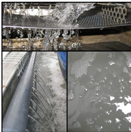
4. Aireación aplicada por gravedad y medios mecánicos

Por las características de nuestra actividad, se ha diseñado y ajustado a nuestras necesidades un sistema que nos ha permitido tratar las aguas residuales producidas por nuestra actividad. Es un método de trabajo sencillo pero práctico, abierto a mejoras continuas y el cual hemos registrado en el procedimiento PC-24 "Tratamiento de aguas residuales" de nuestro manual de gestión (2).