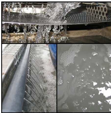
4. Aireación aplicada por gravedad y medios mecánicos

Por las características de nuestra actividad, se ha diseñado y ajustado a nuestras necesidades un sistema que nos ha permitido tratar las aguas residuales producidas por nuestra actividad. Es un método de trabajo sencillo pero práctico, abierto a mejoras continuas y el cual hemos registrado en el procedimiento PC-24 "Tratamiento de aguas residuales" de nuestro manual de gestión (2).