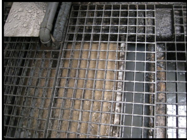
3. Punto de recogida e inicio de la conducción de las aguas residuales

Por las características de nuestra actividad, se ha diseñado y ajustado a nuestras necesidades un sistema que nos ha permitido tratar las aguas residuales producidas por nuestra actividad. Es un método de trabajo sencillo pero práctico, abierto a mejoras continuas y el cual hemos registrado en el procedimiento PC-24 "Tratamiento de aguas residuales" de nuestro manual de gestión (2).