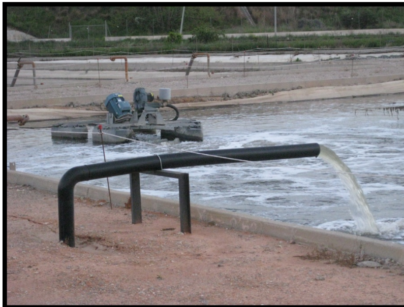
5. Detalle EDARI municipal del polígono industrial

(**) Laboratorios Tecnológicos de Levante S.L acreditación por ENAC Nº 121/LE1782 . Informe de Ensayo Nº de Registro 14AR08465 de fecha 15/10/2014