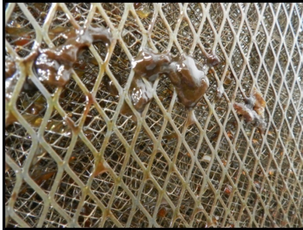
1. Filtro de malla con grasa saturada en estado sólido

La operación de mantenimiento en el establecimiento se puede resumir como la retirada o sustitución de los filtros sucios por otros limpios. Éstos son transportados por la empresa que realiza el servicio hasta el centro o lugar de trabajo donde se va a realizar la limpieza de los filtros de cocina.